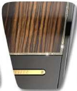
Стразы Swarovski в золотом обрамлении вокруг деревянных панелей из макассара