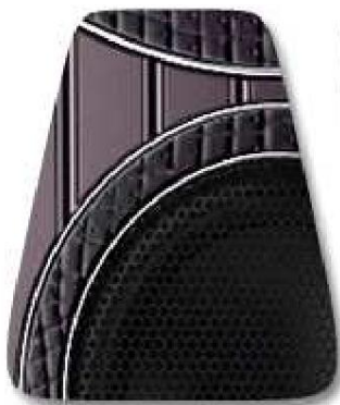
Фланцы из крокодиловой кожи в пурпурной отделке вокруг динамиков