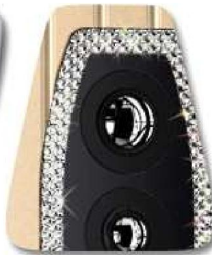
Натуральные бриллианты вокруг твитеров